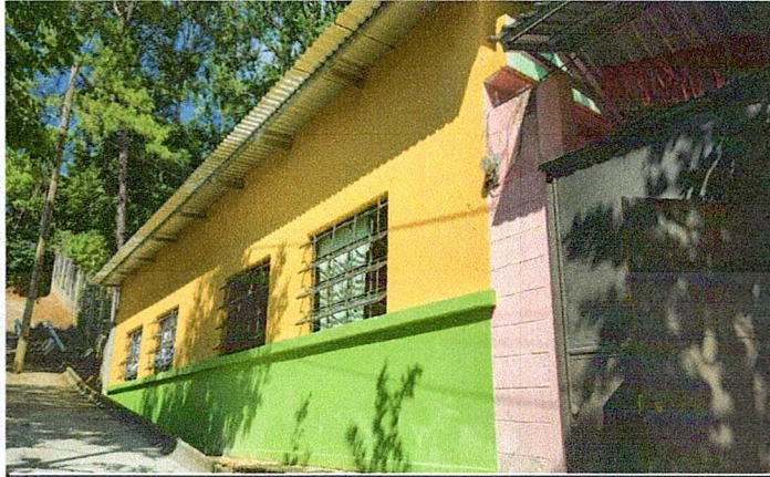
Foto 1: MODULO 1 INSTALACION CAMBIO DE TECHO Y REMOZAMIENTO DE PARED