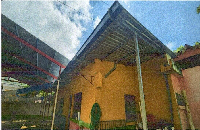
Foto 3: MODULO 2 MEJORAMIENTO INSTALACION CANALES CON BAJADA DE AGUA PLUVIAL